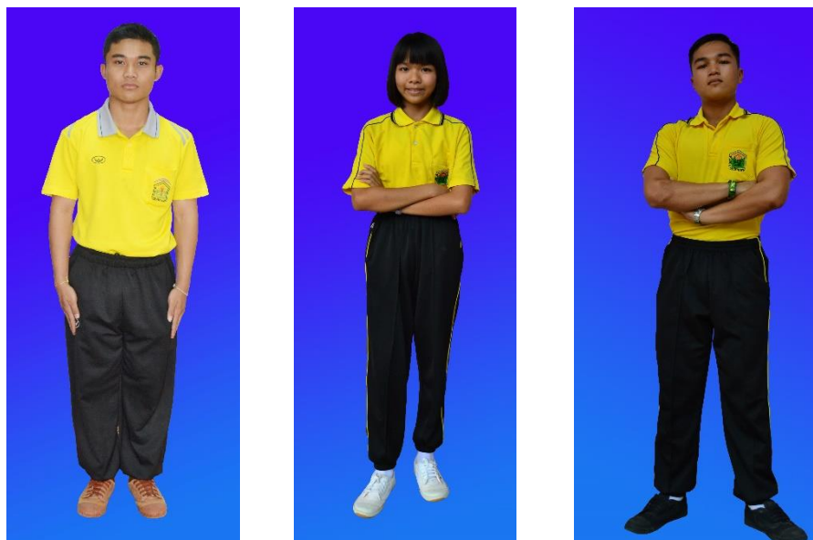
ชุดพลະชาຍ-หญิง (ม.ต้น และ ม.ปลาย)