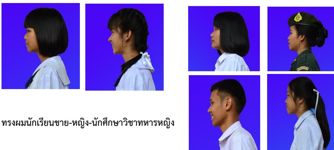
ทรงผมนักเรียนชาย-หญิง-นักศึกษาวิชาทหารหญิง