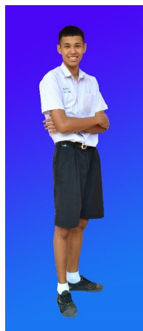
ชุดนักเรียนชายม.ปลาย