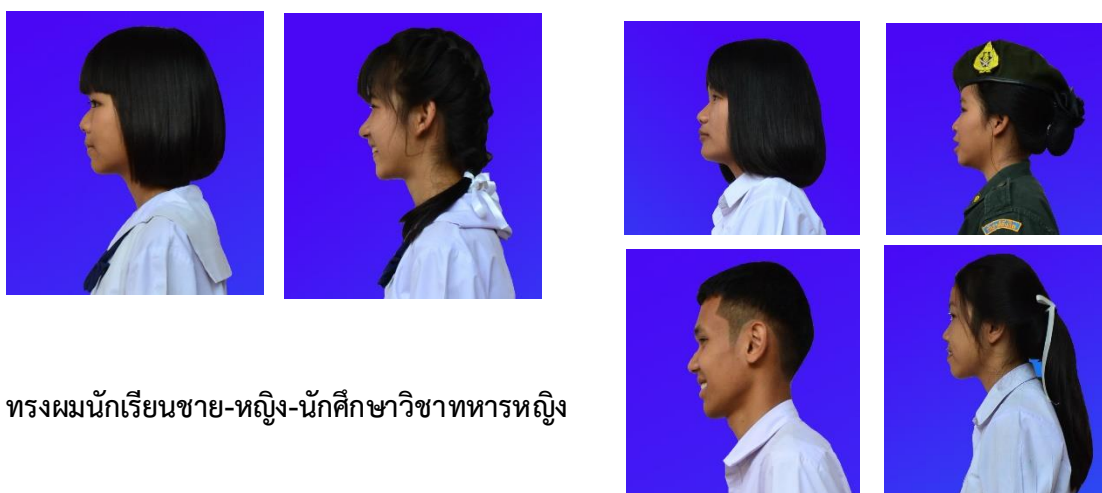
ทรงผมนักเรียนชาย-หญิง-นักศึกษาวิชาทหารหญิง