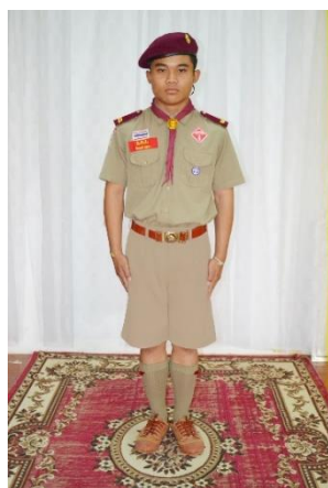
ชุดลูกเสือ-เนตรนารี