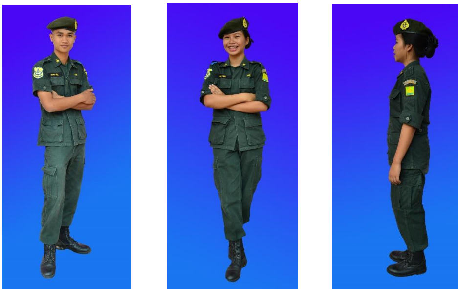
ชุดนักศึกษาวิชาทหารชาย-หญิง